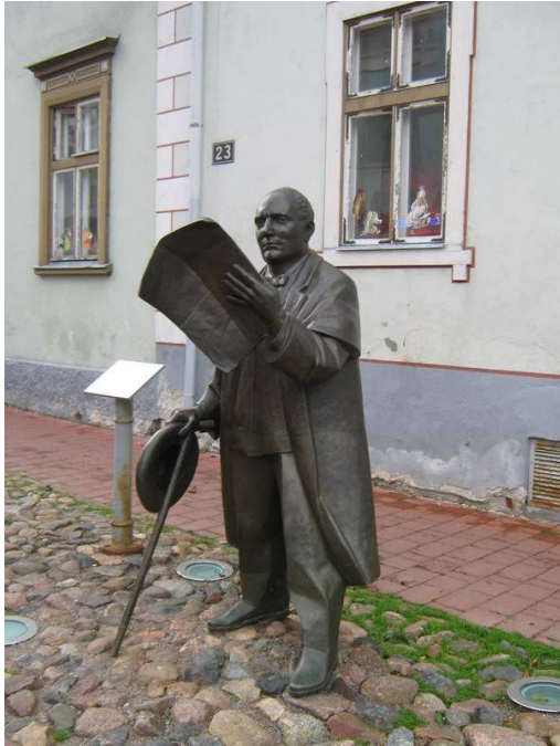
skulptor: Mati Karmin

1857. aastal asutatud ajalehega pani Jannsen aluse Eesti ajakirjandusele